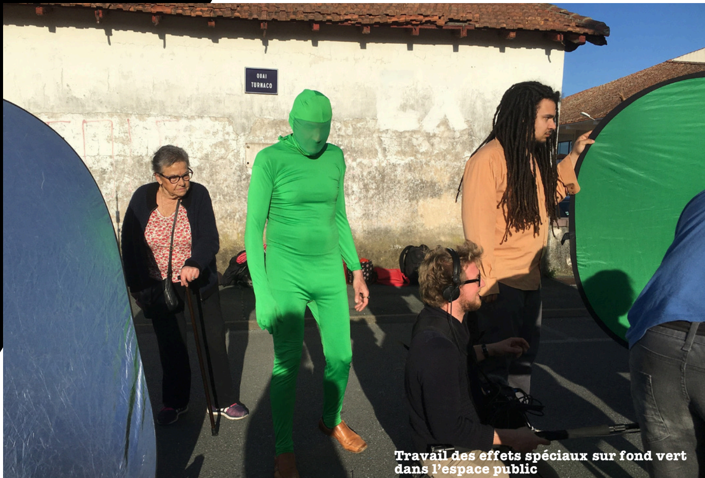
Travail des effets spéciaux sur fond vert dans l'espace public