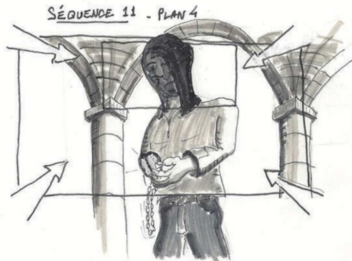
Storyboard : Int/jour, contre plongée PT Guillaume puis travelling avant jusqu'à GP «Guillaume Arsanchal s'accroche à son camée»

Billie Belnoudi, 54 ans, ancienne journaliste d'investigation, a vu sa vie brisée par un attentat dont elle a été la cible. Son fils Robinson en a été la seule victime et il est depuis plongé dans le coma.