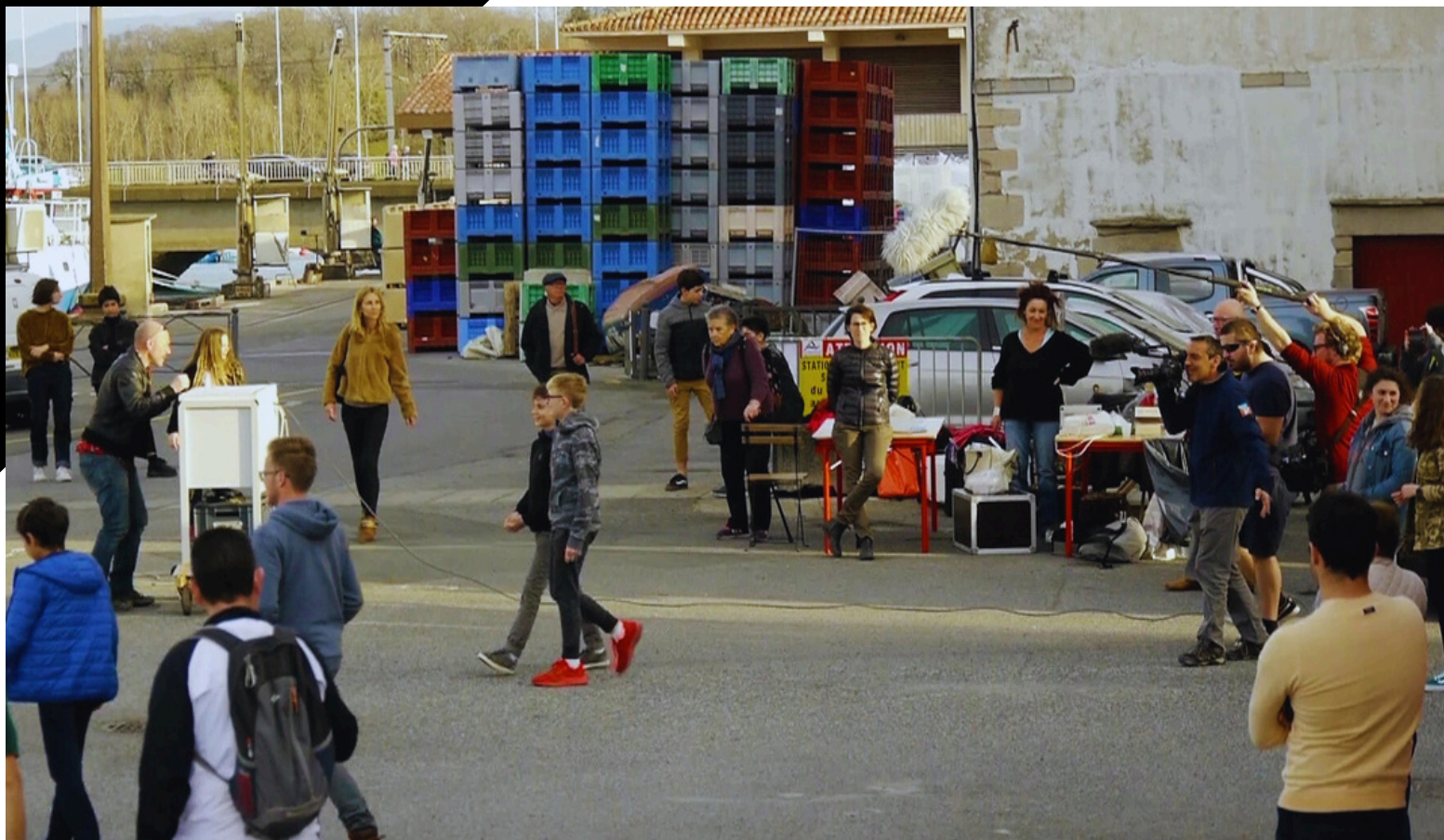
Tournage d'une séquence de foule sur le port de Ciboure