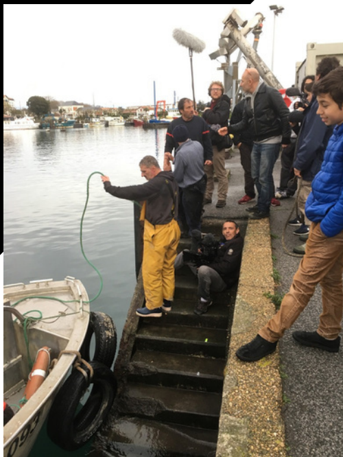
Tournage d'une séquence de la série sur le port de Ciboure.

La série nous offre l'avantage de pouvoir ajuster à loisir le scénario, qui peut trouver un rebond à chaque épisode.