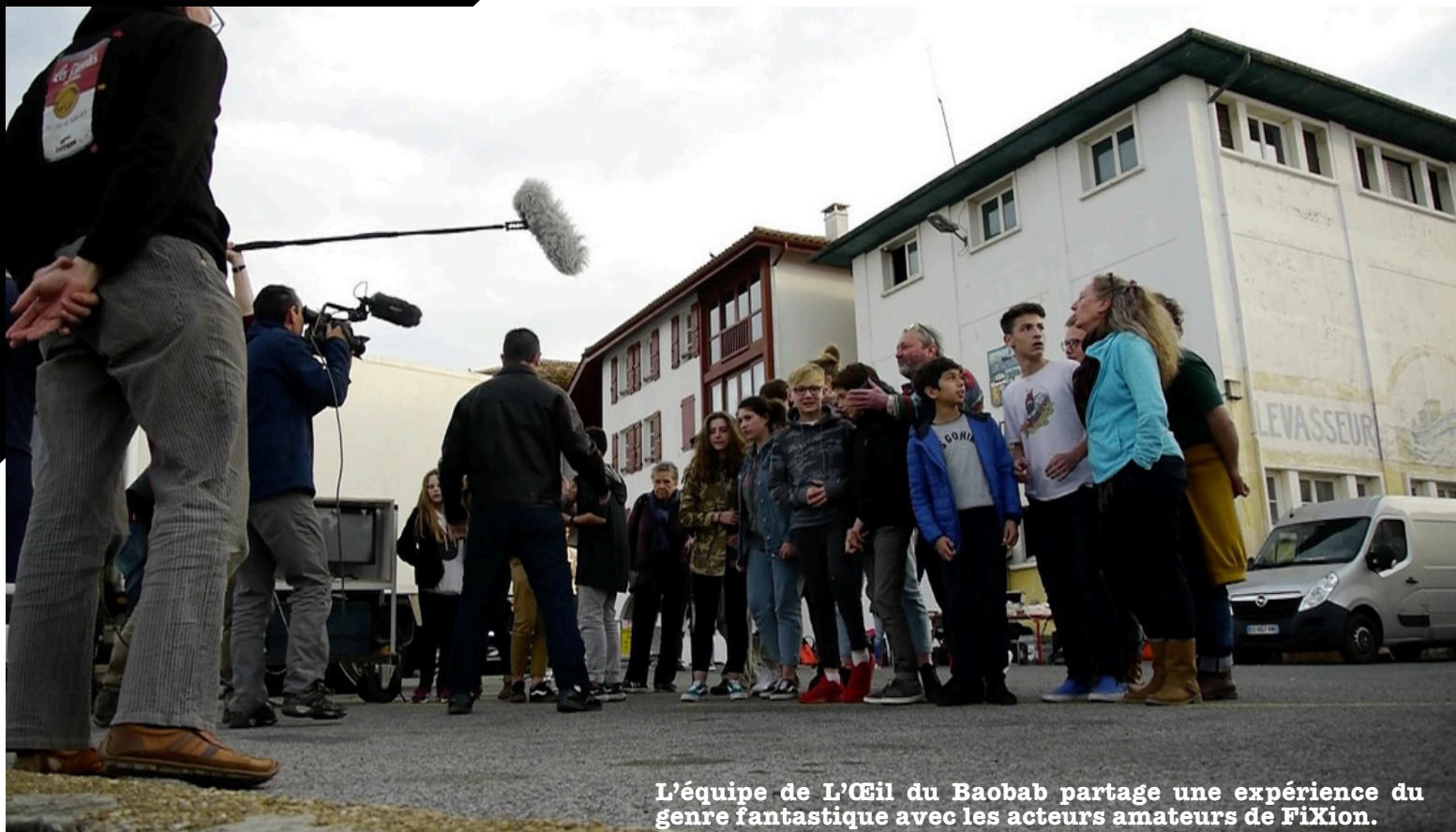
L'équipe de L'Œil du Baobab partage une expérience du genre fantastique avec les acteurs amateurs de Fixion.