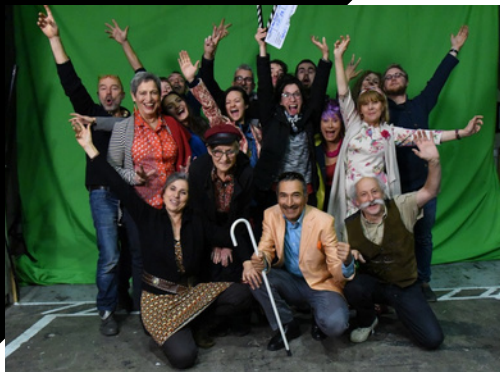
Fin de tournage Route 9.2

Son originalité lui a valu d'être programmé lors d'événements cinématographiques nationaux : la Fête du Cinéma du CNC au Wanderlust, Le Festival des Cinglés du Cinéma à Argenteuil, La Fête du Court Métrage, Cinéma 93, le festival Les 6 Trouilles de Libourne ou encore l'écofestival Le Chahut Vert d'Hornoy-le-Bourg.