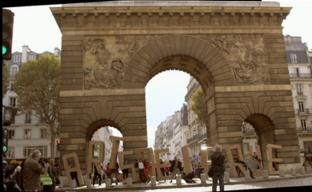
Journée de tournage et montage live - événement Rue Libre