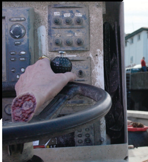
La Main coupée

Renouant avec sa perspicacité et son sens de l'enquête, Billie va découvrir alors que le meurtre n'a pu être commis que dans des circonstances extraordinaires voire surnaturelles.