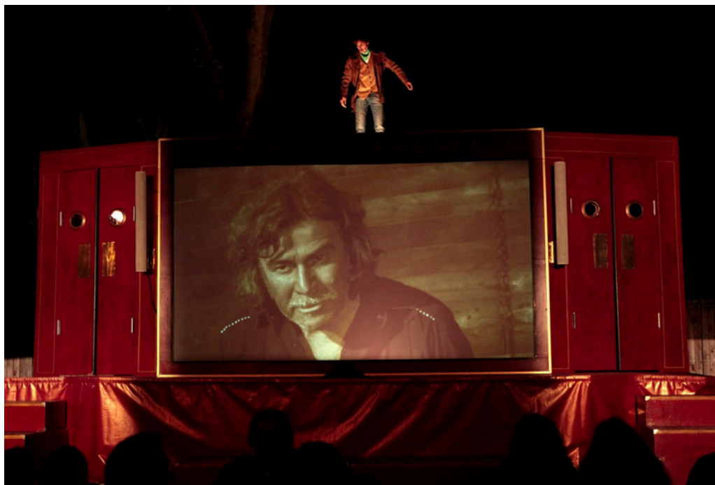
Installation scénique du « Film du dimanche soir »

Cet item regroupe des réalisations passées et en cours, dont certaines sont les racines de notre chantier en construction permanente, FiXion.