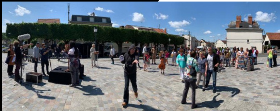
Les participant-es attendent les pompiers qui viennent faire la pluie lors du tournage du court métrage Cumulus.